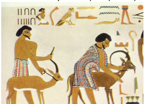
קטע זה של ציור הקיר כולל את שם אַבְיָשִׁי והמספר 22 + 15 = 37

שימור כמות: [אל-ישר]=[15+22]=[ישראל] משמר תיעוד למסר היסטורי המתאר את ירידת יַעֲקֹב לַמִּצְרַיִם, בכתובת שיוחסה ליוסף "צַפְנַת פַּעֲנַח" ותוארכה לשנת 6 למלכות פרעה ח' ח'יפר, בציור הקיר במקדש קבר הנסיך חנוס חותפ' II.