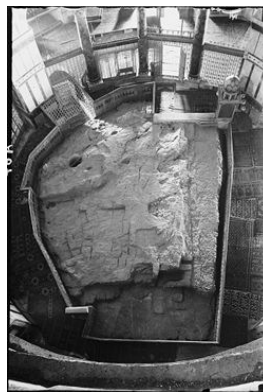
צילום אבן השתייה