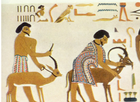
קטע זה של ציור הקיר כולל את שם אָבִישַׁי והמספר 22 + 15 = 37

סיכום הפענוח: [איל-שר]=[22+15]= [ישראל] משמר תיעוד למסור היסטורי המתאר את ירידת יַעֲקֹב למצרים, בכתובת שיוחסה ליוסף "צַפְנֵת פְּעֻנַח" ותוארכה לשנת 6 למלכות פרעה ח' - ח' - ח' - ח' בציור הקיר במקדש קבר הנסיך חנוס חותפ' II.