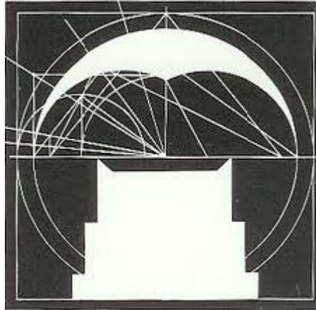
חוג אמות המדה